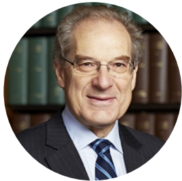
The Rt. Hon. The Lord Mance

Главный судья лорд Манс является главой судебной системы суда МФЦА. Он является бывшим заместителем председателя Верховного Суда Соединенного Королевства.