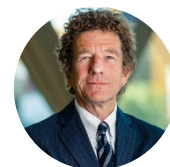
The Rt. Hon. The Lord Faulks QC