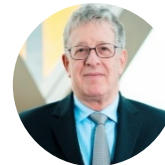
The Rt. Hon. Sir Jack Beatson FBA