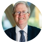
The Rt. Hon. Sir Rupert Jackson