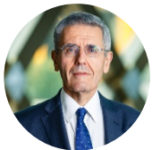
The Rt. Hon. Sir Robin Jacob